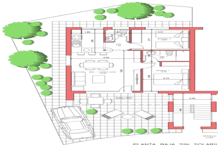
PLANTA BAJA SIN SOLARIUM VIVIENDA 054 SUP. PARCELA= 151,90 M2.